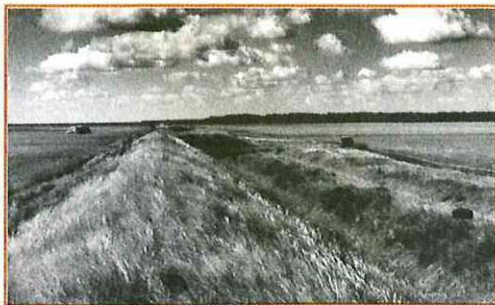
Рис. 77. Остатки степной растительности в районе «Татарского вала» под Тамбовом

В рассматриваемый период заметно изменилось назначение лесных